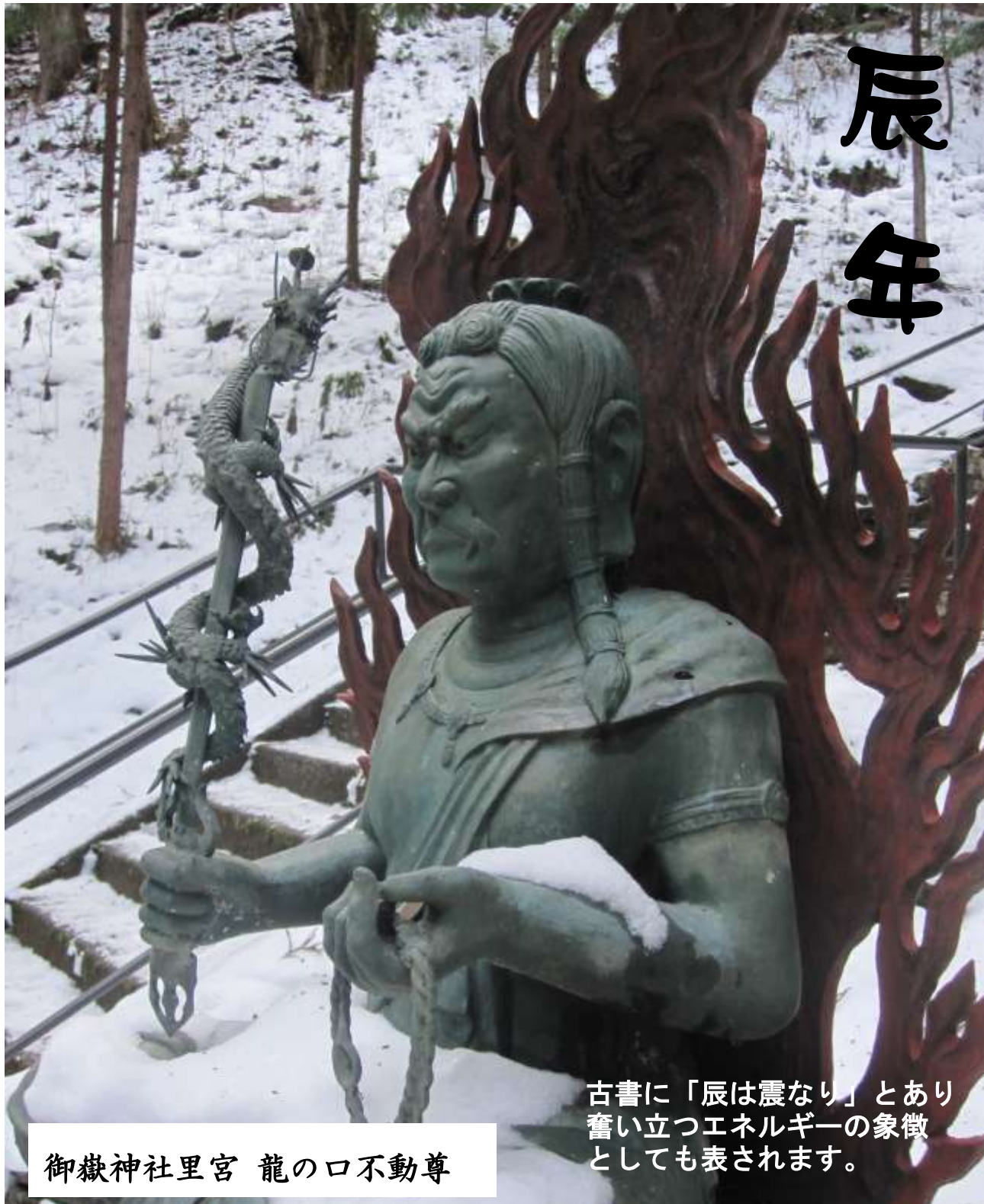
御嶽神社里宮 龍の口不動尊