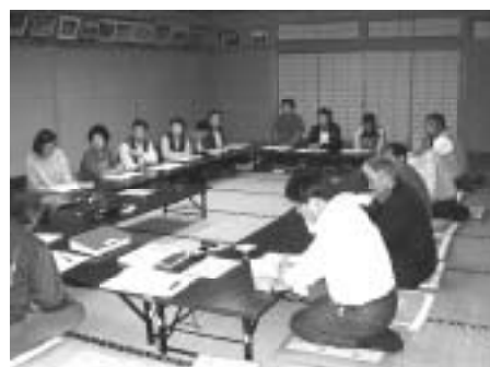
地区懇談会の様子（東区）

とが第一としてきた。住民サービスや福祉が他町村と比べて著しく低くなつていない、その中で借金の返済なので問題は無いと思つている。 問 スキー場の問題でも正しかったと思うか。 答 協定書に基づいてやっており正しかったと思つているが、まだ五ヶ月近くも任期は残っている。 まとめ 債務返済で財政は健全化されても村の衰退を心配