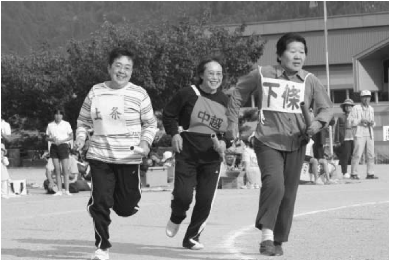
王滝ふれあい運動会（9月19日学校校庭にて）