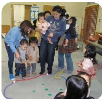
輪投げゲームに挑戦!

一年の締めくくりの今回は、いつも遊んでいるミニ児童館の年末大掃除から始まりました。ボールや遊具などを丁寧に清掃しお年寄りに修理してもらった本棚にきれいに本を並べました。こども達は、きれいになった遊具で早速遊んでいました。恒例のクリスマス会では、お母さん達の手作りケーキが登場。大きく口を開けてほおばり、ほっぺにクリームがつく子どもたちの姿を微笑みながら見守りました。