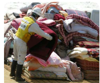
廃棄される 家財道具の 分別作業

東北地方 一部の市町村で個人のボランティアを受け入れています。被災地へ出向く場合は、必ず、各被災地の県社協へ受入状況をお問い合わせください。