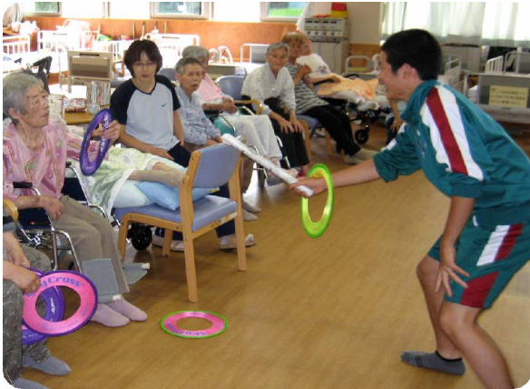
～ デイサービスでレクリエーション～

7月30日、中学2年生の生徒14名が社協で職場体験。デイサービスで利用者の方と接したり、配食サービスでのお弁当配り、館内清掃などをしました。普段の交流事業とは違い、職場としての体験とあって少々緊張した顔立ちでしたが、職員の指導に「はい！」と中学生らしく気持ちいい返事をし、頑張っていました。働くことは大変なことだけど、仕事を通じての喜びもたくさんあります。将来に向けて、もっともっといろいろな事を学んでほしいですね。