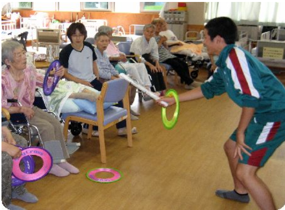
～ デイサービスでレクリエーション～

7月30日、中学2年生の生徒14名が社協で職場体験。デイサービスで利用者の方と接したり、配食サービスでのお弁当配り、館内清掃などをしました。普段の交流事業とは違い、職場としての体験とあって少々緊張した顔立ちでしたが、職員の指導に「はい!」と中学生らしく気持ちいい返事をし、頑張っていました。働くことは大変なことだけど、仕事を通じての喜びもたくさんあります。将来に向けて、もっともっといろいろな事を学んでいってほしいですね。