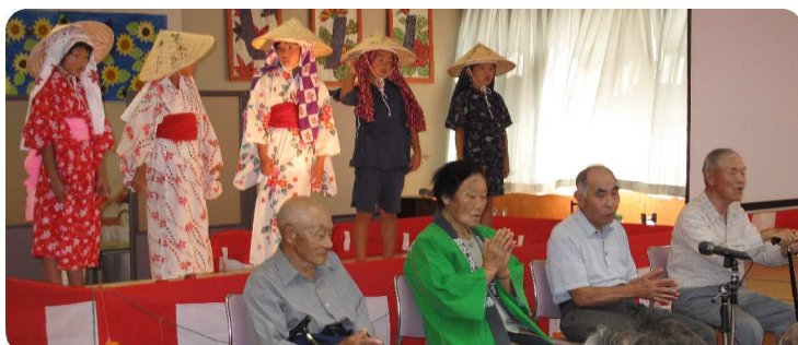
小学1、2年生とおじいちゃん、おばあちゃん先生の木曾節ショー