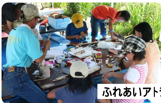
ふれあいアトラクション