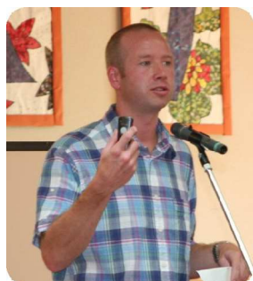
学校のエリック先生 トークショー