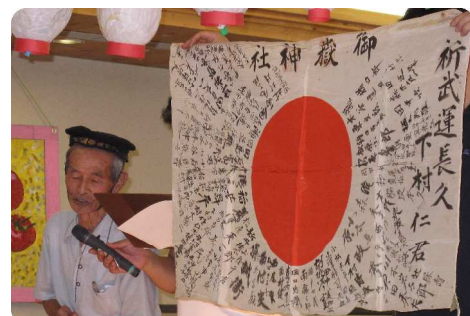
お宝なんでも自慢コンテストが行われました。