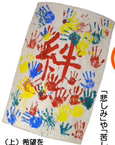
(上) 希望をのせて～来場者の皆さんで大きな凧を制作

「私たちが今生きている「命」、十代さかのぼれば2,024人もの祖先の命を受け継いで生きています。その一人が欠けても今の自分はいないし、いろんな考え方があって当然。「生きる」ことを意識すること、は、「生かされている」ことを意識すること。いろいろなあるけど、「ありがとう」の素直に言える人間に。「こめんなさい」が素直に言える人は、誰からも好かれる。「悲しみ」や「苦しみ」