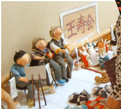
おなじみの王寿会の高齢者の皆さんの手芸作品。毎年、「ほっ！」とさせられますね。

「お年寄りが元氣な村は、みんなが元氣になれる・・・。」 今年度の福祉・健康の集いでは高齢者の皆さんにスポットを当て、いきいきと輝いている元氣なお年寄りを紹介するコーナーなども設けられました。