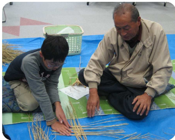
なかなかむずかしいなぁ～

11月の「ごたくらぶ」では、小学校5年生の子どもたちと「わら細工」で交流会をおこないました。9月の小旅行で訪れた木曽町のふるさと体験館で習ったカメの飾物を、おじいちゃんが子どもたちに教えながらみんなで作りました。毎年12月に小学生と老人クラブでしめ縄講習会で知っているおじいちゃんもいて、和やかなムードで交流できました。