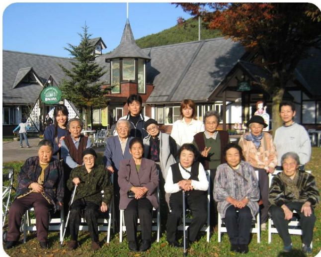
～ 道の駅 長谷 にて ～

いきいきサロンでは恒例の日帰り旅行に出かけてきました。今回は、駒ヶ根市と伊那市へ行きました。