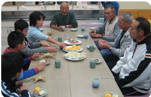
～ 楽しい交流会になりました!! ～

また、みんなでお茶を飲みながら、おじいちゃん達に完成した飾物を見てもらい、「思ったよりうまくできた!」と満足げに話していました。おじいちゃん先生たちは、昔作ったわら細工の話をしながら、「今度は、しめ縄講習会で会いましょう。」と意気込んでいました。