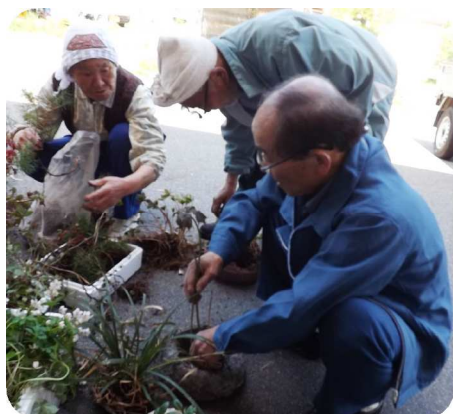
自分だけの寄せ植えづくり

今月のごたくらぶは、「ペタンク」という軽スポーツを楽しみました。的に向かってボールを投げ入れるスポーツですが、チームに分かれて相手チームの邪魔をしたり、中には最後の一投で大逆転する場面もあり、一投ごとに歓喜の音が沸きあがりました。