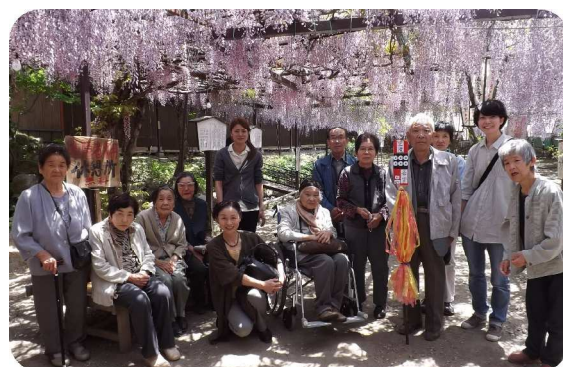
満開の大藤をバックにハイポーズ!

松川町の温泉施設では、昼食をとりゆっくりと温泉に入ったり、休憩施設で休みながら「あそこも行きたいね！」など早くも来年の行き先を話して盛り上がりました。途中で買物を楽しみながら、たくさんのお土産と茶のみ話を抱えて王滝へ帰ってきました。