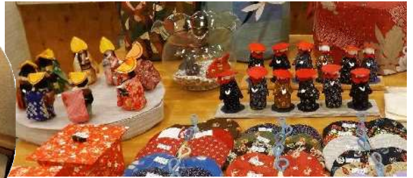
佐渡おけて(左)とかわいらしい六地藏(五郎ハ茶屋)