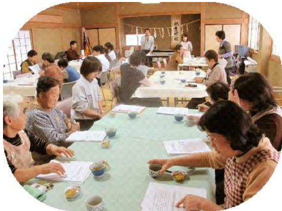
上条区で行われた情報交換会。身近な介護の問題についてともに考え、学び合いました。

そのような中で、ひとり暮らしの方をはじめ地域で援助が必要な方の日常生活の支援や、災害時における支え合い活動、また、在宅での介護のあり方やボランティア活動の育成など、今後の地域における支え合い活動のあり方