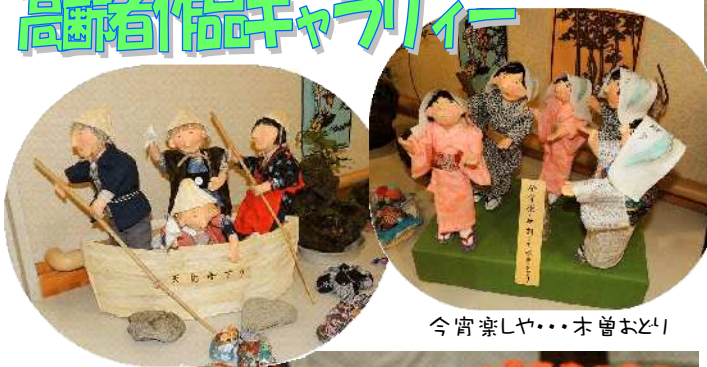
今宵楽しや...木曾おどり

福祉・健康の集いや郡の高齢者作品展に出品された手芸作品。どれも創意工夫され、人柄がにじみ出る作品ばかりです。