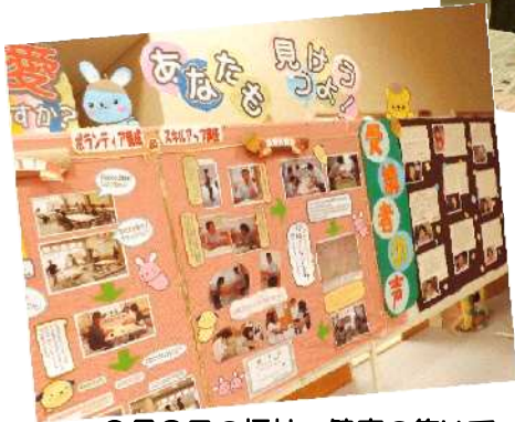
9月8日の福祉・健康の集いでは、講座の様子や参加者の感想をまとめて展示しました。

Hさん「自分がやる気になって動かなければ人とのつながりはできない。ひとひとりの小さな力が大きな力になる。」