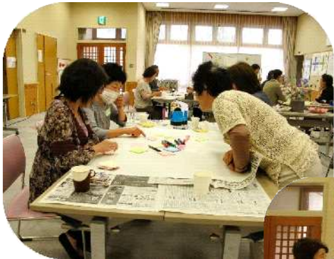
グループに分かれて、地域の現状や身近な問題を思いつくままに書き出してみました。