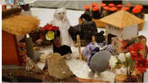
高野山の石堂丸物語を題材にした作品

福祉・健康の集いや郡の高齢者作品展に出品された手芸作品。どれも創意工夫され、人柄がにじみ出る作品ばかりです。