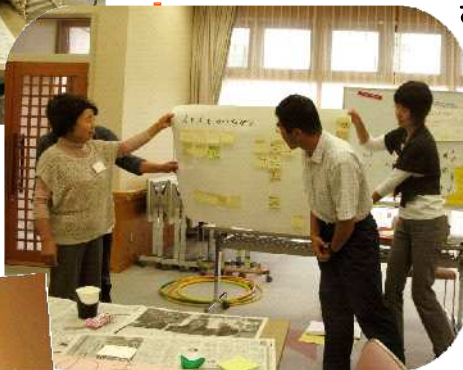
グループごとに支え合い活動のテーマを決めて発表。テーマに沿って、地域の中で自分ができることを考えて実践してみることにしました。