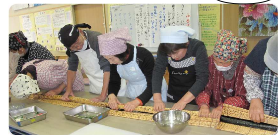
父ちゃんも母ちゃんも先生もみんな 「せ~の!」。声を合わせて協働作業。 楽しそうで最高!!