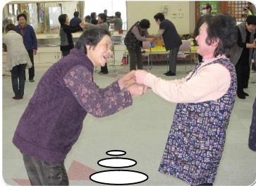
「今年もよろしく。」挨拶し ながら、「ワッハッハ!」