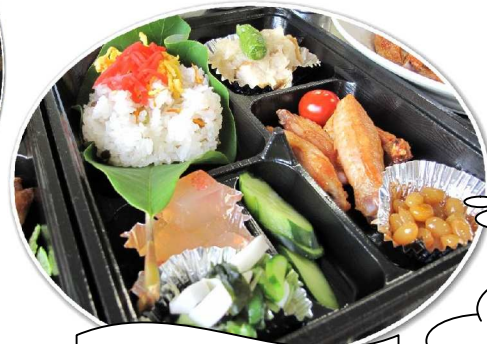
6月ほうぼ寿司弁当

また、随時ボランティアを募集していますので、興味のある方は連絡ください! (社協※※48-2008)