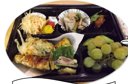
9月長寿お祝いご膳