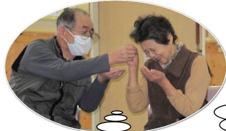
酒を注ぎあいなが ら、「ワッハッハ!」