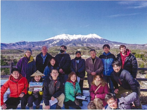
集まったみなさまと天気とお山に感謝！

翌日21日は、王滝村と木曾町三岳、開田高原を舞台にフィールドワークを行いました。冬の木曾路の素敵な表情を見ていただけて私たちも大満足♪ この地域を越えた温かな繋がりと情熱を、これからの火山防災活動、地域づくりの大切な糧にしていきたいと思います。(近藤)