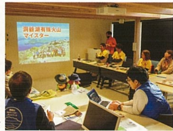
活動報告 & 質疑応答