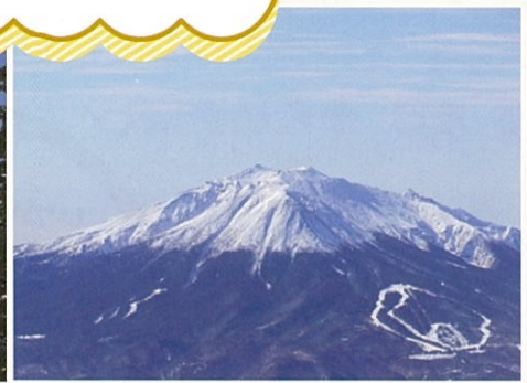
乗鞍岳から見える御嶽山