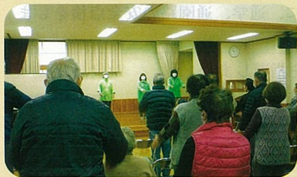
管内の公民館において高齢者に対する交通安全教室を開催した。(小諸)