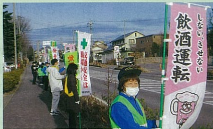
「年末の交通安全運動」で、御代田町内の県道において飲酒運転防止などと呼び掛けた。(佐久)