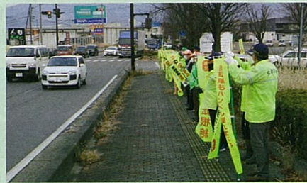
「年末の交通安全運動」の活動で、松代大橋前県道において街頭啓発活動を実施した。(長野南・松代)