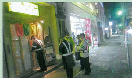
「年末の交通安全運動」で、飲食店を対象とした「飲酒運転防止パトロール」を実施した。(飯伊)