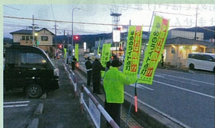
「年末の交通安全運動」で、市役所西県道交差点において街頭啓発活動を実施した。(茅野)