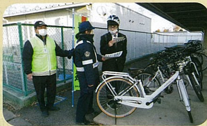
「年末の交通安全運動」の活動で、管内の高校において自転車ヘルメットの着用啓発を実施した。(須高)