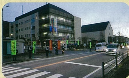
「年末の交通安全運動」で、諏訪警察署前において街頭啓発活動を実施した。(諏訪)