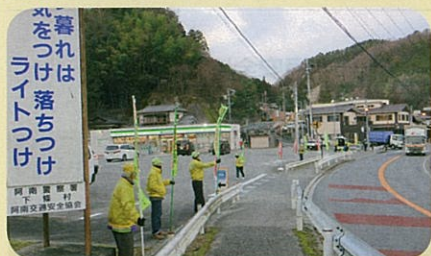
「年末の交通安全運動」で、管内の国道において街頭啓発活動を実施した。(阿南)