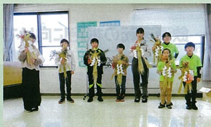
「年末の交通安全運動」で、少年部による交通安全を祈願した「正月飾り作成研修会」を開催した。(安曇野)