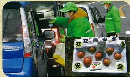
「年末の交通安全運動」で、ドライバーに「交通安全文字入りりんご」を手渡して交通事故防止を指導した。(川西)