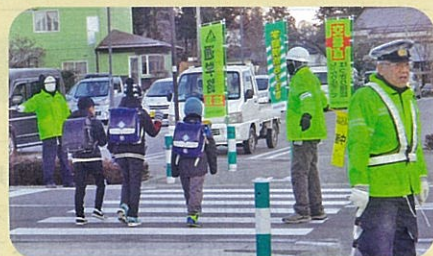
「年末の交通安全運動」で、通学路において児童に対する見守り活動を実施した。(池田松川)