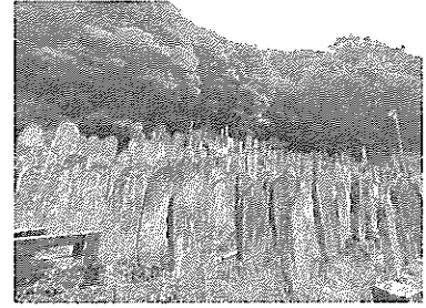
木曾町に立つ霊神碑 ※

御嶽山に対する信仰は、中世の時代から栄えたといわれています。かつては厳しい修行を重ねた人々のみが登拝（神仏を拜むための登山）することができる山とされていましたが、江戸時代中期には、一般民衆に開放され、御嶽信仰もまた全国的に広がっていきました。江戸末期には集団で御嶽山に登拝する「御嶽講」が500以上あったといわれ、現在でも、御嶽山は山岳信仰の場として確かに存在しています。