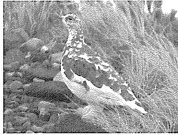
御嶽山で撮影されたライチョウ

黒沢口登山道は標高2,150mまでおんたけロープウェイが運行。山頂側の駅である「飯森高原駅」には高原植物園が隣接しており、「高山植物の女王」と呼ばれるコマクサを見ることができます。そして王滝口登山道田の原天然公園では、オヤマリンドウ・コバイケソウ・クロユリ・イワカガミ等の高山植物にも出会うことができます。