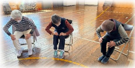
内側と外側から押し合います。地味ですが息が切れます。