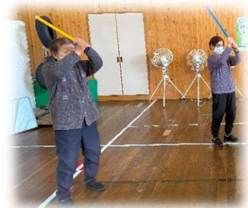
大きく振りかぶって「エイ!」・「エイ!」・「エイ!」

明け方に雪が降り、日陰だけうっすらと雪が残った三月十日のニコニコ軽体操教室は、十名の方が参加されました。 太ももの筋肉を引きしめる内転筋プレスは、ひざの動きに合わせて両手で圧力をかけて行う筋トレで、太ももの外側、内側、かかと上げを順番に行いました。皆さん息を止めないようにゆっくり数を数えながら、行うことができました。