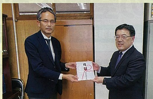
「信越放送株式会社」様

令和7年9月に、日本生命保険相互会社 長野支社・松本支社様より、また、令和8年1月には、信越放送株式会社様より、当交通安全協会が実施しております交通安全広報啓発活動等の一助として、寄付金を贈呈いただきました。交通安全協会では、いただいた寄付金を今後の各種交通安全啓発活動に有効活用して参ります。