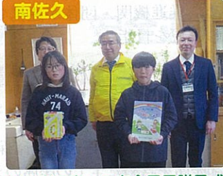
南佐久 新入学児童への安全冊子贈呈式