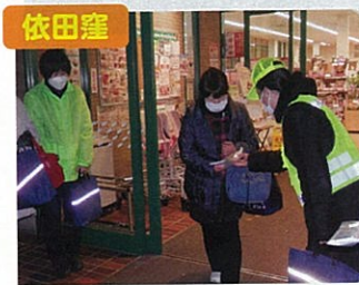
依田窪 ピカピカパタンコ作戦