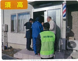
須高 高齢者宅訪問