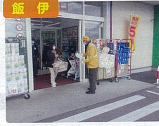
飯伊 交通死亡事故抑止対策