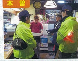
木曾 飲酒運転防止パトロール