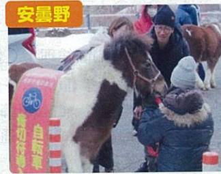
安曇野 午年の啓発活動