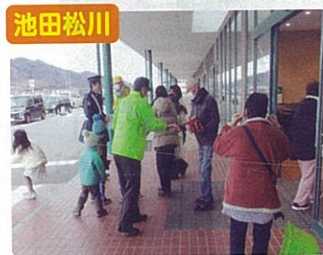
池田松川 街頭啓発活動