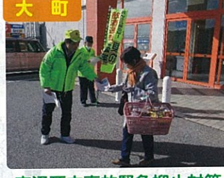
大町 交通死亡事故緊急抑止対策