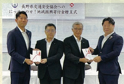
「日本生命保険相互会社 長野支社・松本支社」様