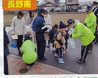
長野南 幼稚園児への交通安全指導