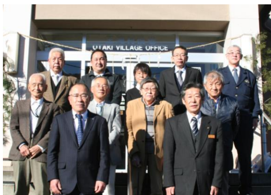
※二子持区長は欠席