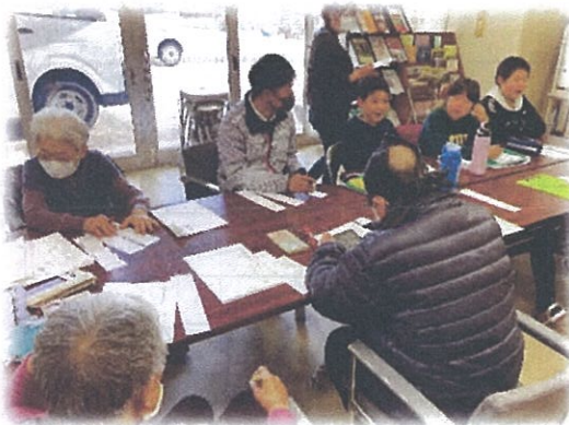
楽しい俳句は、公民館に掲示します

500回目を記念して、小学生7名が参加して、上五・中七・下五のそれぞれの句を書いて、混ぜ合わせて引いていくゲームをしました。普段、考えもしない俳句がたくさんでき、児童たちも俳句会の方々も笑いながら楽しんでいました。俳句会の皆さんも「いい交流になった」と喜んでくれました。1月には、「俳句でハイク冬」があります。