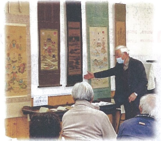
長年にわたって収集された江戸末期からの貴重な資料が、数多く展示されました。