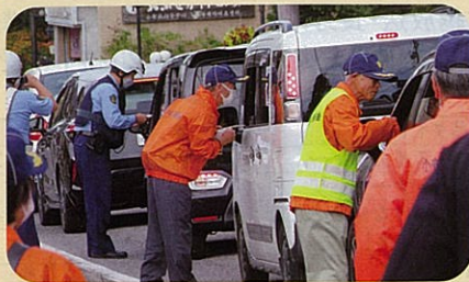
管内の主要交差点において交通事故防止啓発活動を実施した。