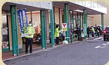
管内の商業店舗前で交通事故防止を目的とした啓発活動(サンセット作戦)を実施した。