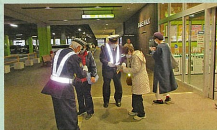
夜間における交通事故防止啓発活動として、管内の大型商業施設においてサンセット作戦を実施した。