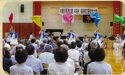
管内の小学校体育館において「高齢者交通安全大会」を開催した。