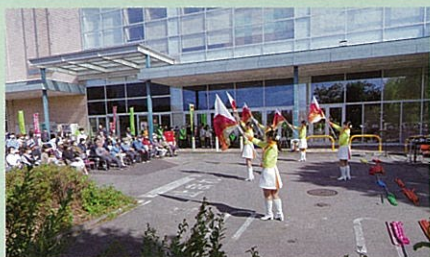
管内の商業店舗で県警音楽隊の演奏等を含めた交通安全イベントを実施した。

交通安全協会は、交通事故をなくすため、様々な活動を行っています。活動の一例を紹介します。