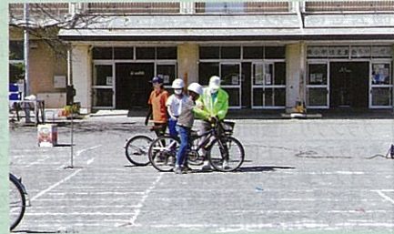
市内の小学校の交通安全教室において、児童に自転車の正しい乗り方について指導した。