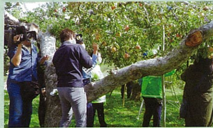
交通安全活動の一環として関係機関に配布する「交通安全リンゴ」のシール貼りをを行った。