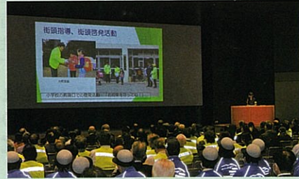
「交通安全協会長野県大会」において活動事例を発表した。