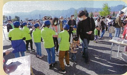
警察署主催のふれあいコンサート会場において少年部員による啓発活動を実施した。