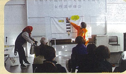
管内の公共施設において女性部研修会を実施した。