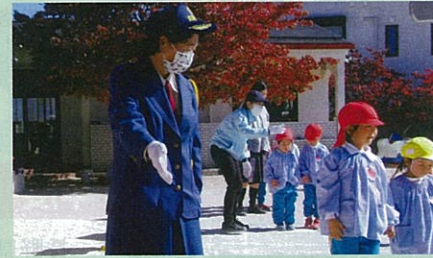
市内の幼稚園において女性部と市の交通安全教育担当で交通安全教室を実施した。