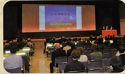
「交通安全協会長野県大会」において活動事例を発表した。