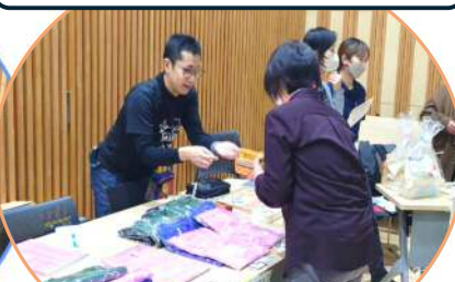
手話エンターテイメント発信団 oioi