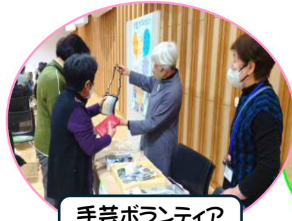
手芸ボランティア いぶき