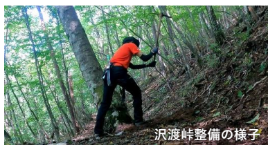
沢渡峠整備の様子

コロナの影響がいつまで続くかは見当もつきませんが、いずれにしましても将来を見据え、リース時の一時的な来訪に終わらない環境づくりに今後もしっかり取り組んでいきます。