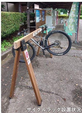
サイクルラック設置状況

6月の設置から3ヶ月経過し、先定期点検を実施しました。今後は使用状況アンケート結果をラックの改良に繋げていきます。