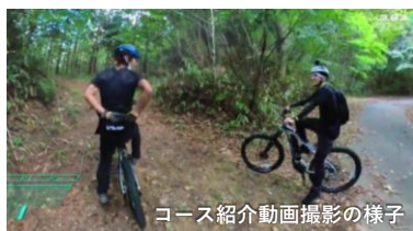
コース紹介動画撮影の様子