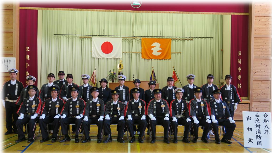
令和8年 王滝村消防団 出初式