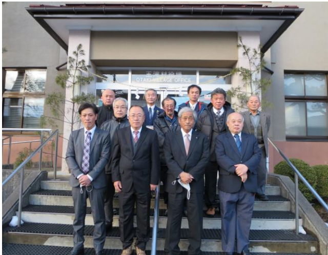
※二子持区長は欠席