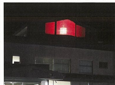
12月：世界エイズデー (レッド)