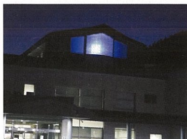
11月：世界糖尿病デー (ブルー)