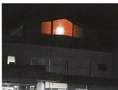
9月：アルツハイマー月間 (オレンジ)

9月より、病院外壁工事により行っていなかったライトアップを再開しています。今年度も様々な疾患の啓発月間等に合わせて、17:00~21:00までライトアップを行っていきます。9月はアルツハイマー月間(オレンジ)、10月は乳がん月間(ピンク)、11月は世界糖尿病デー(ブルー)に合わせて行い、12月は世界エイズデーに合わせてレッドライトアップを行っています。お近くに来た際はぜひご覧ください。また、ホームページには月ごとのライトアップに関する情報を掲載していますので、そちらも合わせてご覧ください。