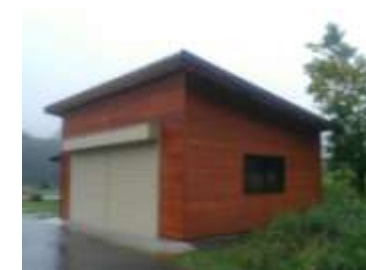
松原スポーツ公園倉庫新設 ステージ改修等 662万円