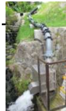
小水力発電・送電設備 設置工事 1,004万4千円