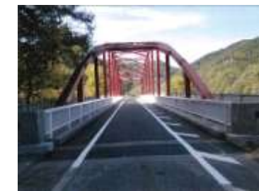
瀬戸川橋橋梁修繕工事 1,346万8千円