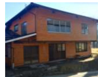
村営住宅古民家再生事業 1,293万6千円