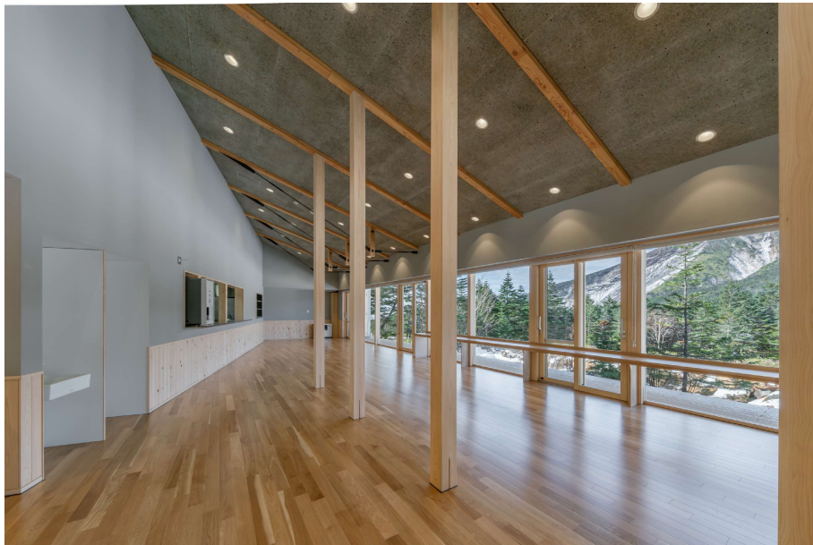
10 飲食スペース(北から)