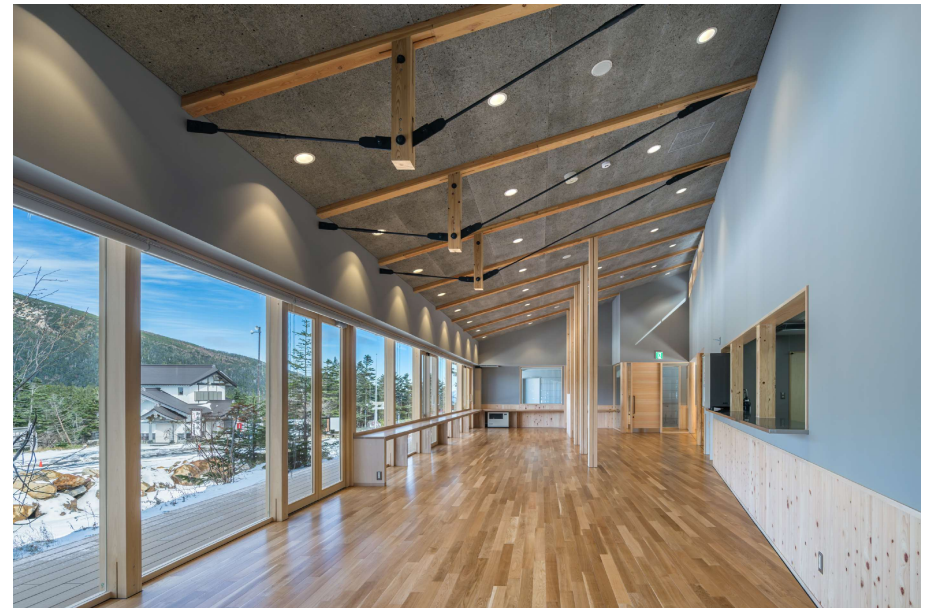
08飲食スペース(南から)